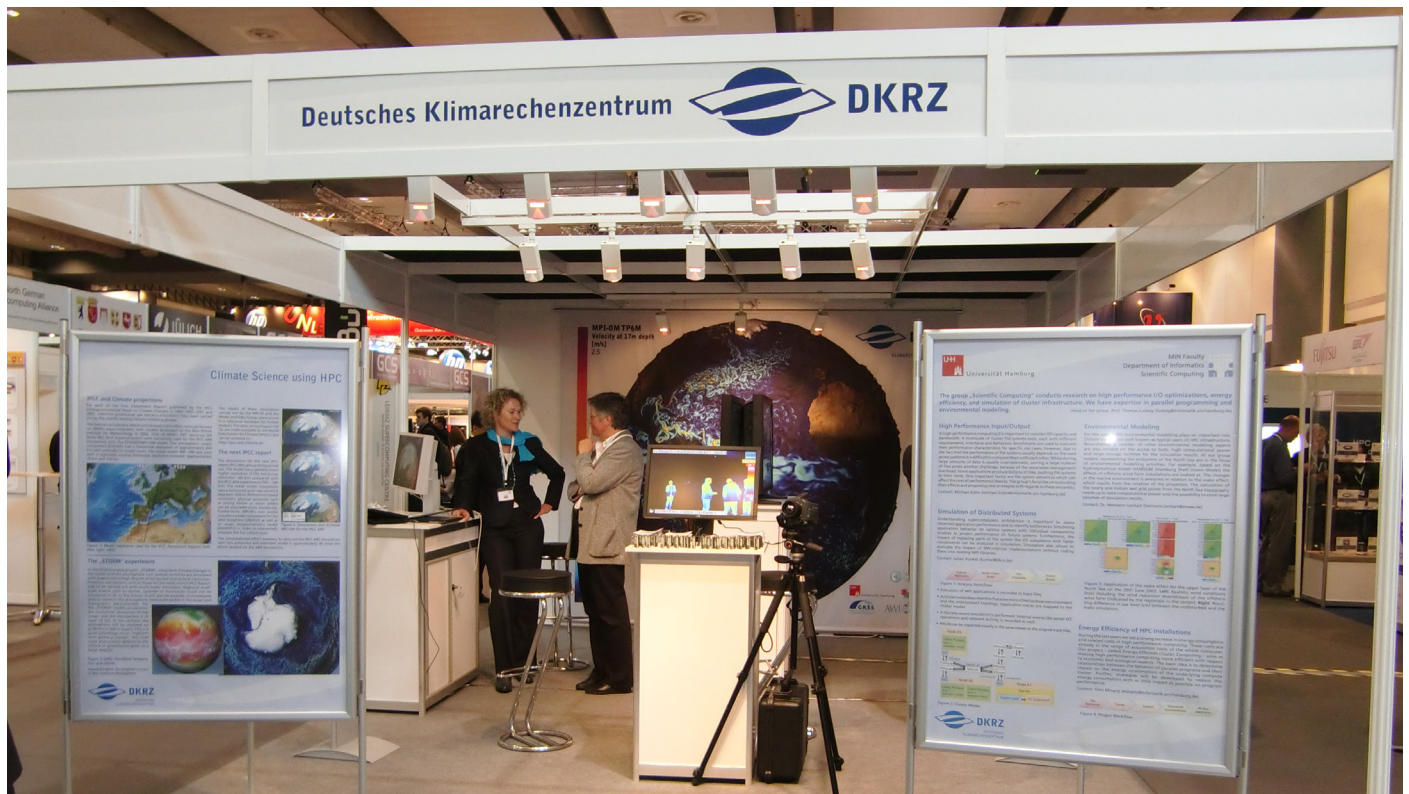
Der Messestand des DKRZ auf der ISC'10.

Im KlimaCampus-Projekt STORM werden langfristige Klimaänderungen über mehrere Jahrhunderte in Ozean und Atmosphäre mit einer