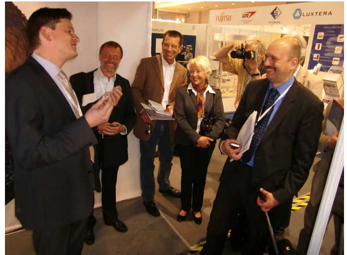
Stopp des Presserundganges am DKRZ-Stand zur Eröffnung der ISC'10 am 31. Mai 2010.

Am Stand des DKRZ wurden gemeinsam mit einigen der wichtigsten Nutzern des DKRZ, dem Max-Planck-Institut für Meteorologie (MPI-M) sowie dem KlimaCampus Hamburg, Visualisierungen von aktuellen hochauflösenden Klimaberechnungen vorgeführt, die erst durch die Leistung und Effizienz des